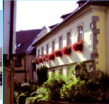
Weingut Wolfram u. Bernhard König im Bergmeisterhaus