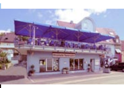
Winzerkeller, Ochsenfurter-Str. 7