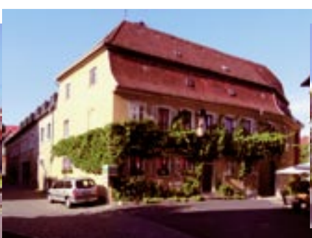
Weingut Schmitts Kinder,