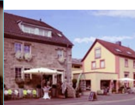
MainCottage, Würzburger-Str. 7