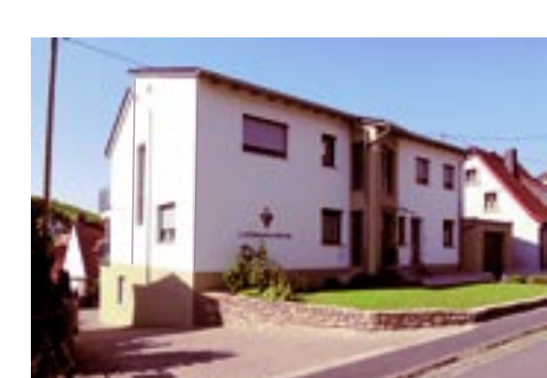
Weingut J. Störrlein & Krenig