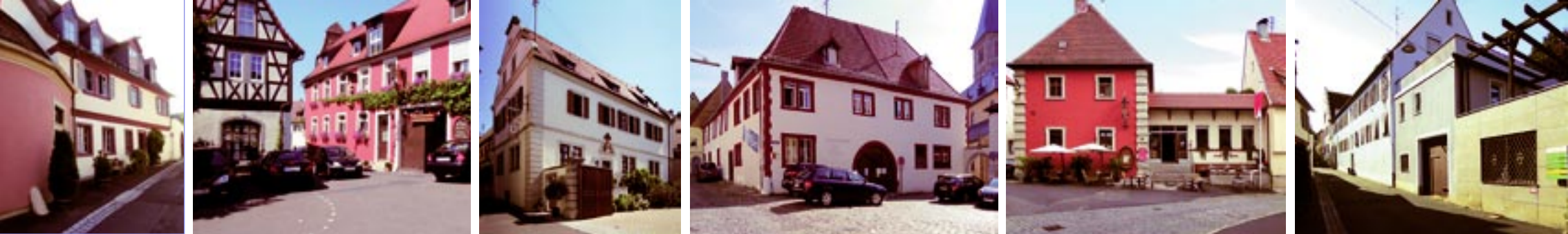
Weingut Wilhelm Arnold Weingut Trockene Schmitts Weingut und Weinstube Edelhof Winzerhof Martinshof Weinhaus Ewig Leben Weingut Richard Schmitt

Der neue terroir-f-punkt am Sonnenstuhl wird am 9. Sept. 2016, 11.00 Uhr eingeweiht, hierzu herzliche Einladung